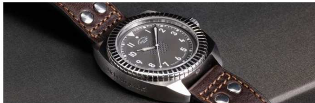
PRIM Nebeští jezdcí LE (ref.: 93-313-513-00-1)