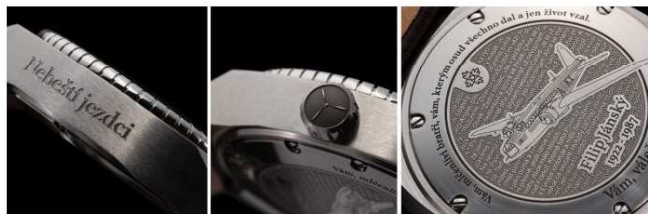
PRIM Nebeští jezdcí LE (ref.: 93-313-513-00-1)

Nový, počtem 164 kusů limitovaný, počín hodinářů z Nového Města nad Metují má robustní ocelové pouzdro o průměru 45 mm. Na něm je vyryt nápis Nebeští jezdcí. Na dýnku upevněném šrouby jsou vyryta životní data autora románu, reliéf bombardéru Vickers Wellington, úryvek textu i nejznámější citát z knihy – věnování válečným letcům. Korunku ozvláštňuje vrtule bombardéru.