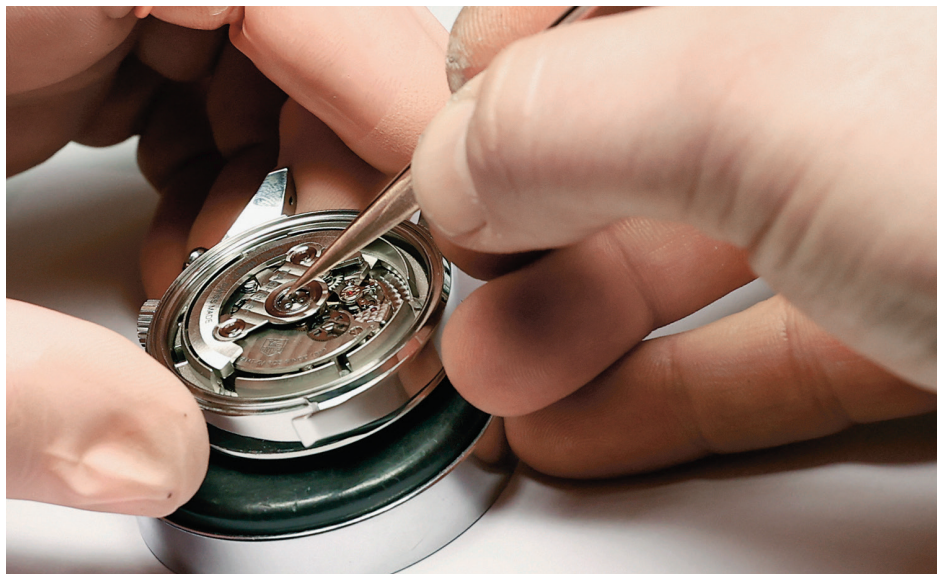
Co je jemná hodinářská práce, člověk pochopí až v hodinářské dílně.