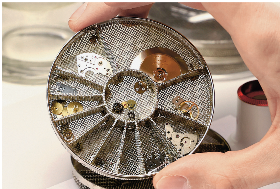
Při opravě se rozebrané součástky přehledně roztřídí.