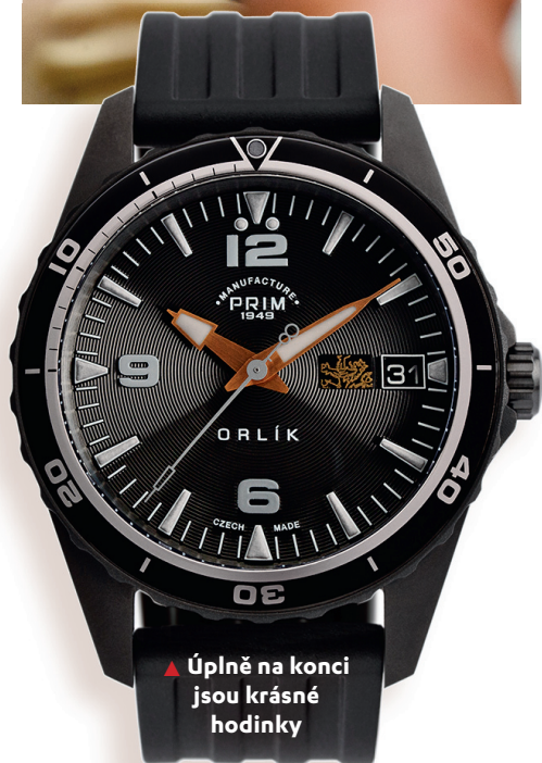
▲ Úplně na konci jsou krásné hodinky

s vytačenou podobou číselníku. Ta se natře barvou a setře tak, aby barva zůstala jen tam, kde má. Následně se na matrici přitiskne silikonový tampon a otisk se přenesení na plíšek - budoucí číselník. Pokud je barev více, opakuje se totéž znovu pro každou barvu zvlášť. Celý proces se nazývá tamponový tisk. Kromě této metody se používají