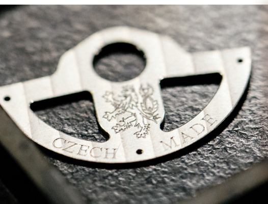
▲ V Novém Městě nad Metují nezapomínají ani na detaily

milimetrové součástky do hodinového strojku. Opak je ale pravdou, na začátku výrobního procesu skutečně jsou pouze dlouhé tyče, plechy a dráty. Z nich zanedlouho vznikne přes 150 různých dílků. Každý z několika speciálních strojů vyrábí jiný typ součástek. Většinou vyrobí celou sérii stejných dílů najednou. Pře-