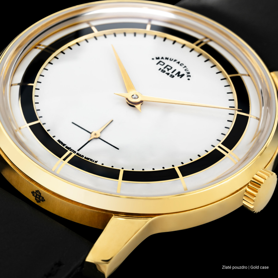
Zlaté pouzdro | Gold case