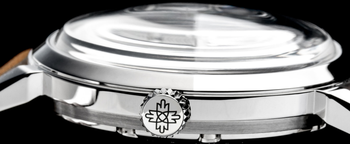
Leštěné pouzdro | Polished case