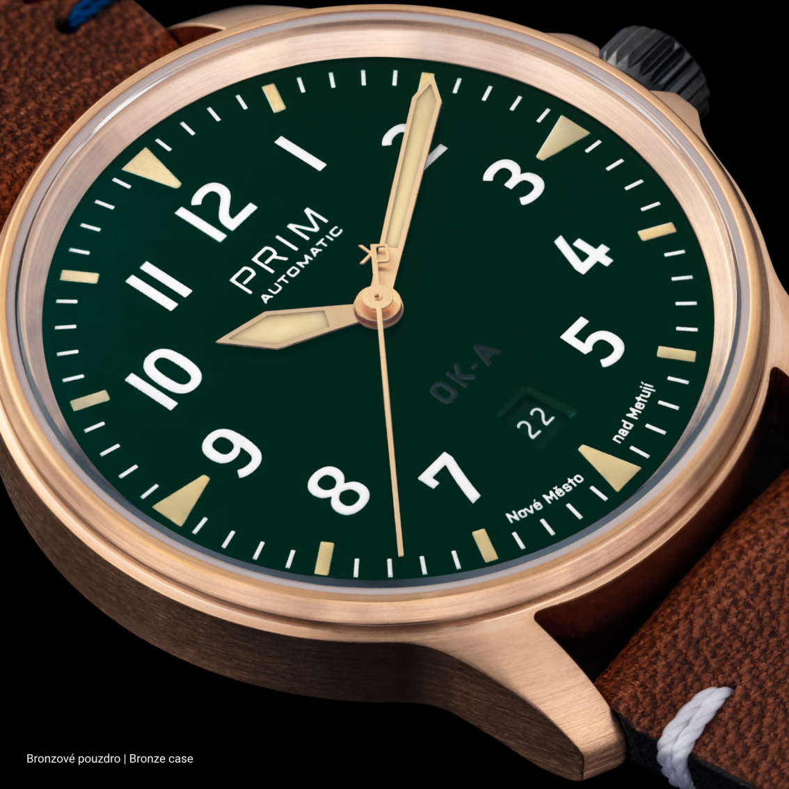
Bronzové pouzdro | Bronze case