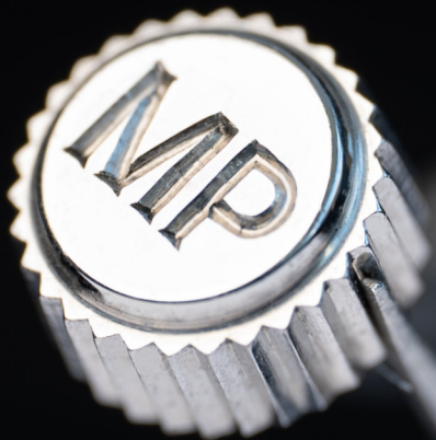
Korunka s ručním rytím | Hand graving crown