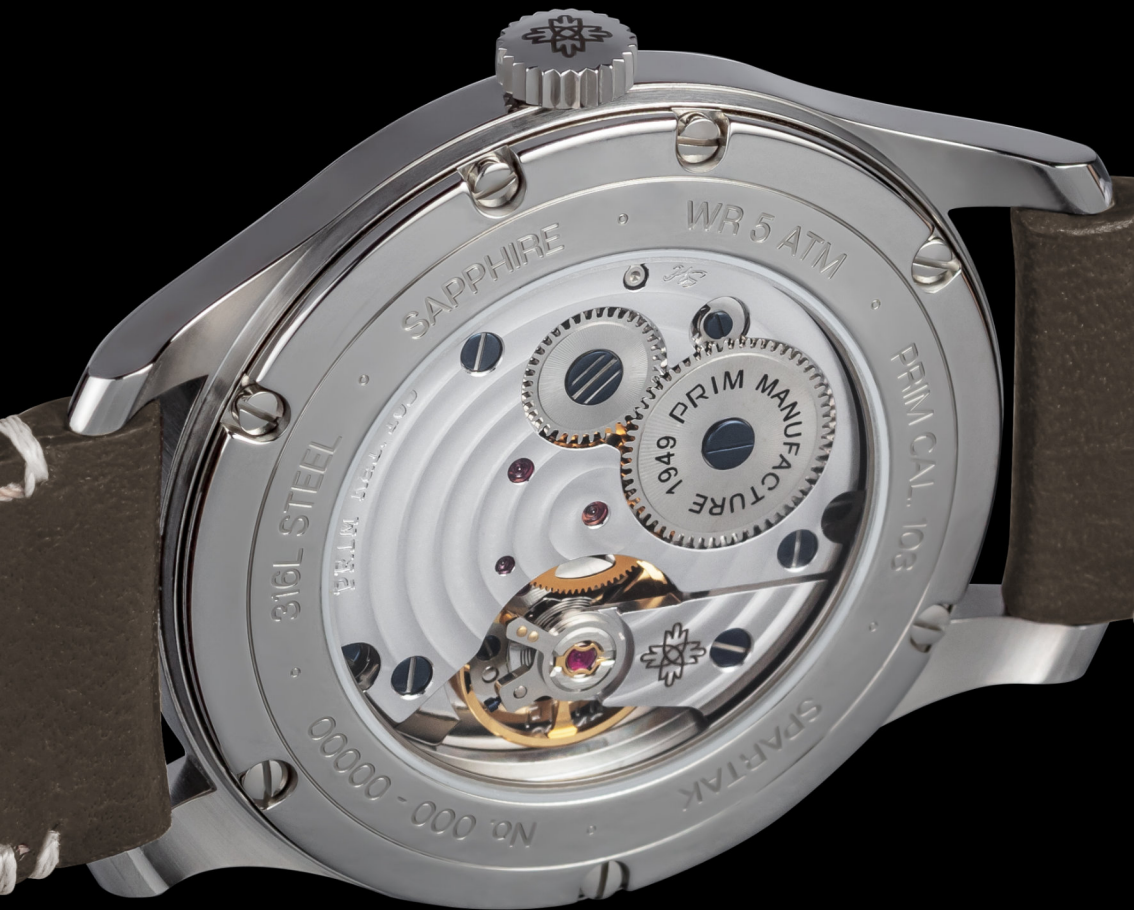
Průhled na strojek, personalizovaný text okolo skla | Transparent caseback, text according to the client's wishes