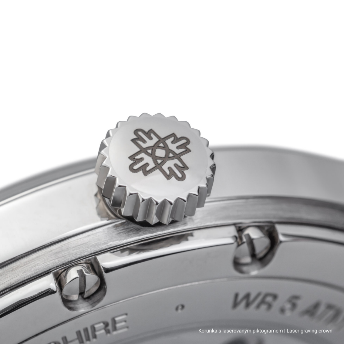
Korunka s laserovaným piktogramem | Laser graving crown