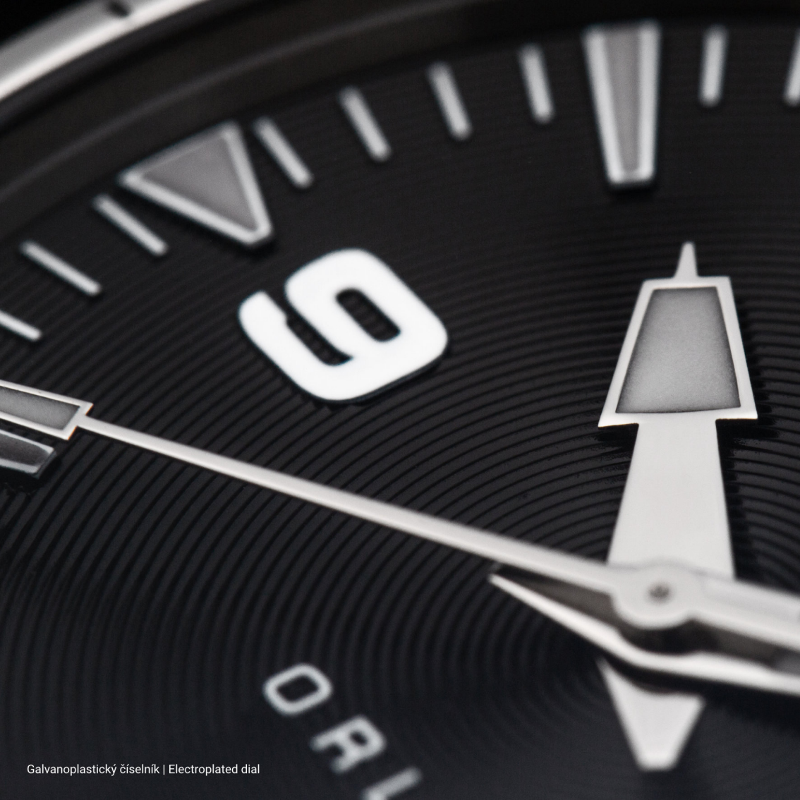
Galvanoplastický číselník | Electroplated dial