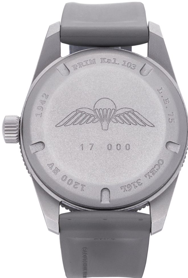
Víko zdobené gravírováním | Caseback machine engraving