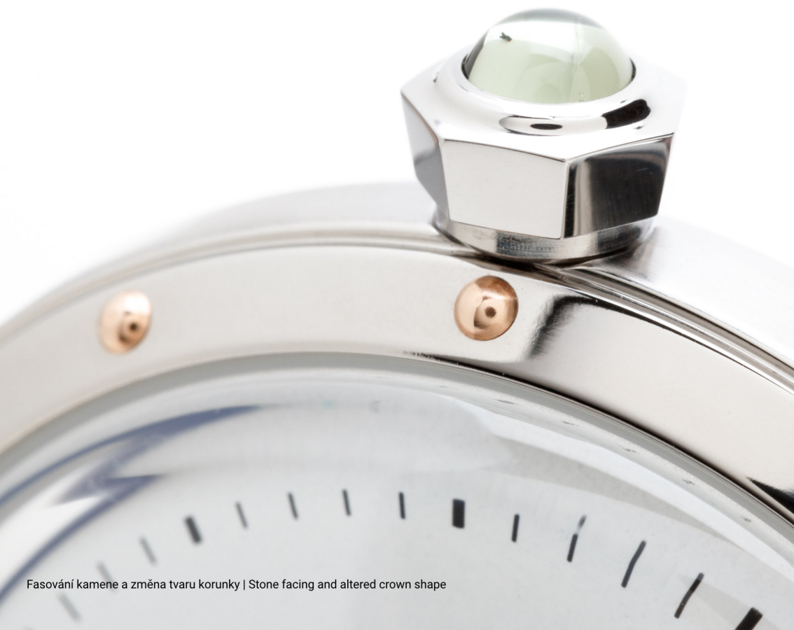
Fasování kamene a změna tvaru korunky | Stone facing and altered crown shape