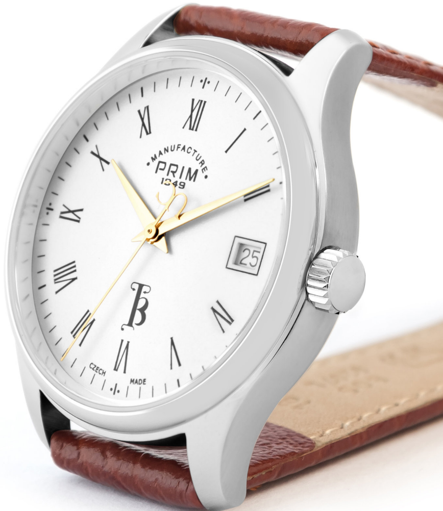
Unikátní tvar ruček, firemní znak | Unique hands, company emblem