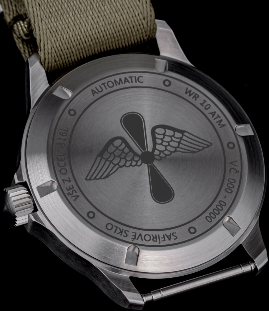
Víko s grafikou provedenou laserem | Laser engraving caseback