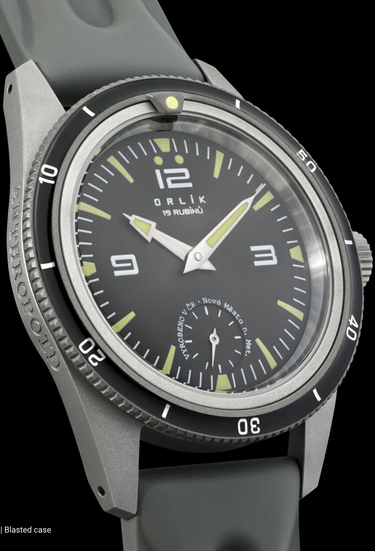
Tryskané pouzdro | Blasted case