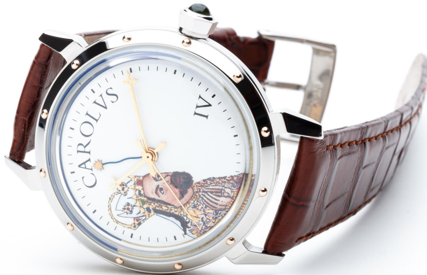
MODEL: PRIM KAREL IV. LE smalovaný číselník