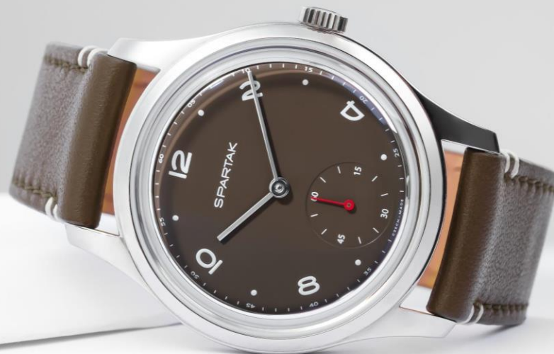
MODEL: PRIM SPARTAK 39