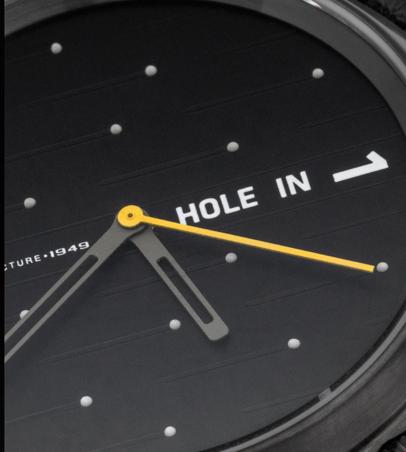
MODEL: PRIM HOLE IN ONE 100 LE