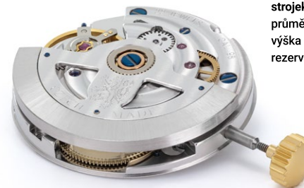
strojek: PRIM kalibr 98.01 průměr strojku: 29,6 mm výška strojku: 7 mm rezerva chodu: min. 45 hodin