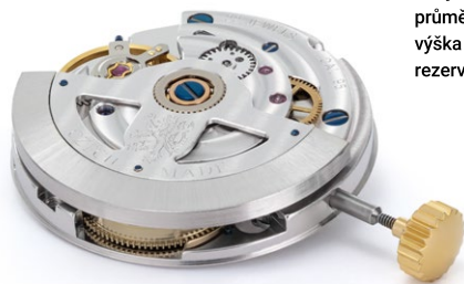
strojek: PRIM kalibr 95 průměr strojku: 25,6 mm výška strojku: 6,3 mm rezerva chodu: min. 48 hodin